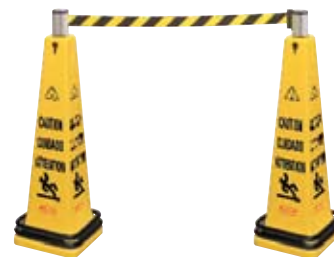
6287 (Cant. 2)