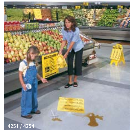
4251 / 4254