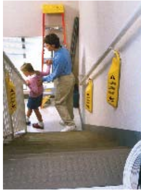
Flexible locking-style hanger helps keep sign in place.